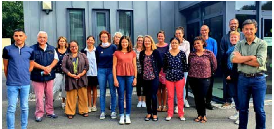
Les équipes des écoles, composées des enseignants, des ATSEM, du personnel de cantine, garderie, ménage et ALSH se sont retrouvées pour préparer la rentrée des élèves jeudi 2 septembre.

Les élèves ont regagné, plein d'enthousiasme leur classe, depuis le jeudi 2 septembre. Ils appliquent le même protocole sanitaire qu'au mois de juin dernier. Un allègement de ces mesures a été opéré dès le 4 octobre.