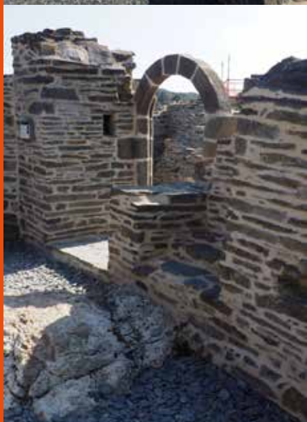
Hervé Le Bras

Symbolique de l'emplacement de la geôle sous la tour d'artillerie ou de l'habitation en haut de l'escalier.