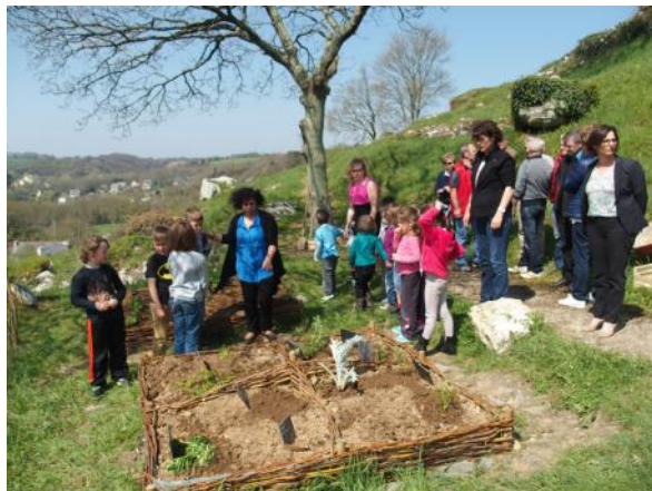
Les plantes ont été choisies et fournies par les jardiniers de